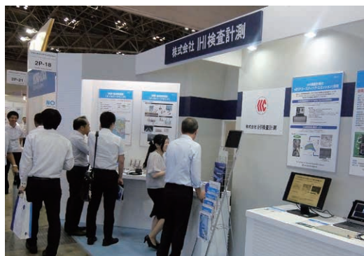
写真1 メンテナンス・レジリエンス TOKYO2016