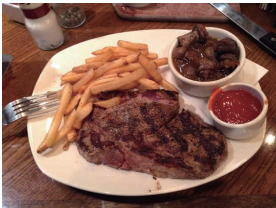
写真3 本場のステーキに舌鼓

日本ではあまり口にしない料理ですが、郷に入っては郷に従えと食べていたら、あっという間に体重が増加してしまいました(写真3)。サンアントニオは全米でも肥満都市といわれていますが、皆さん割と健康に気を使っているようで、レストランでは全部食べずに残りを容器に入れて持ち帰るのが普通のような感じでした。出されたものは全部食べるという日本的考えの私には無理でしたが…。