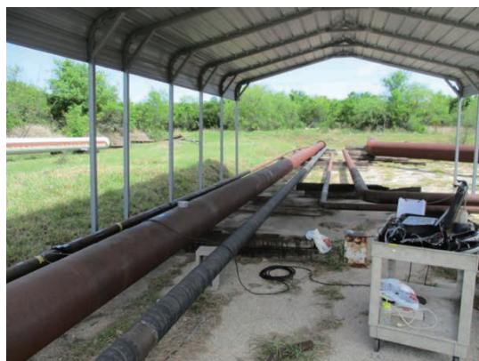
写真 4 屋外実験場