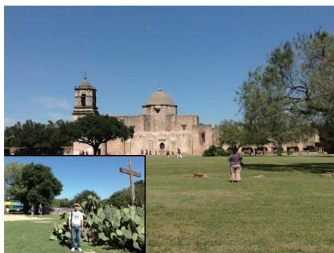
写真1 ミッション(キリスト教伝道所)

て、最後まで戦闘を繰り広げた歴史的に有名なアラモ とりで (日本では映画で有名)を代表とするミッション(キリスト伝道所)や、サンアントニオのベニスとも称されるリバーウォーク等の見所があり、休日ともなれば観光客で賑わっています。しかしハイウェイで15分も車を走らせれば、緩やかな丘陵地帯に牧場が点在するのどかな風景を楽しむこともできます(写真1、写真2)。