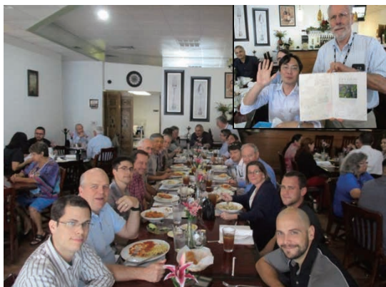
写真 5 SwRI メンバー達との最後のランチ

この間には、私一人の力では実施不可能な作業も多々あったが、SwRI の技術者・研究者の力を借りて成し遂げることができました。まずは SwRI のメンバー達にこの場を借りて感謝をしたいと思います（写真 5）。また ISwT メンバーとの久しぶりの再会など、6 ヶ月間の滞在を通して非常に有意義な生活を送ることができました（写真 6、写真 7）。