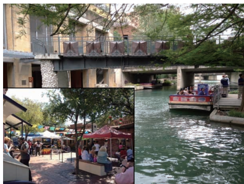
写真2 ダウンタウンの観光地