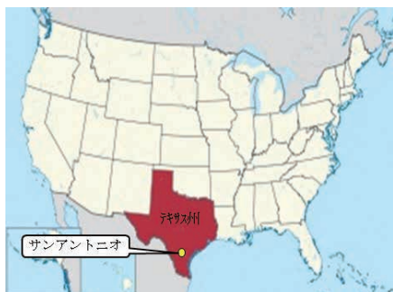
図1 テキサス州サンアントニオ(出典:ウィキペディア)

サンアントニオ市は全米第7の人口を有し、住みやすい温暖な気候もあり、ここ数年で人口が急速に増加している都市です(図1)。滞在先の SwRI は中心部の西南に位置し、空港からは車で20分ほどの場所にあります。なおダウンタウンには、かつてメキシコ領からテキサス独立を求め