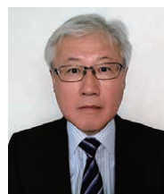
研究開発センター 技師長 博士(工学)