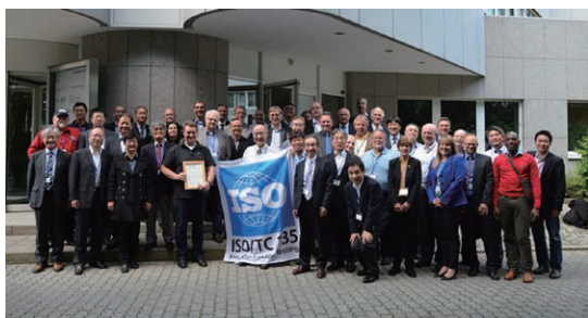
写真1 2016年6月ISO/TC 135総会・ドイツ非破壊検査協会前にて (3)

ISO国際会議には、World Conference for NDT(WCNDT)などの国際会議に併設して開催する全体会議(写真1参照)やSC会議のほか、各SC幹事国が個別に開催するSC会議やWorking Group(WG)会議がある。このSC会議では、主にISO委員会のSC担当が日本代表として出席する。